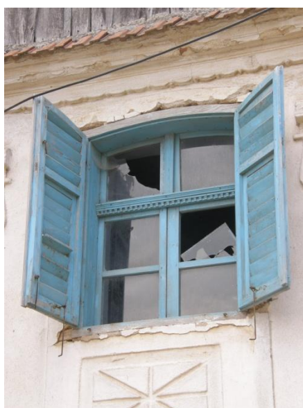
Gerník, 2015, okenní výplně ze 30. Let 20. Století, vnitřní výplň je čtyřkřídla, vnější dvoukřídlová žaluzie

a přímo navazovala na vjezdovou bránu do dvora. Veranda stávala na zděné podezdívce, dřevěné sloupky vynášely podélnou vaznici, na níž spočívaly krokve napojené na stropní trámy přesahující líc zdiva. Střecha nad verandou byla pultová a plynule navazovala na střešní rovinu domu. Byla krytá stejnou krytinou, zpočátku šindelem, později pálenou taškou. Veranda byla otevřená, spodní partie byly buď plné, deskové, nebo doplněné pouze plaňkami. Hlavní vstupní dveře byly rámové, s ozdobnými kazetami, byly plné. Okenní výplně tvořily převážně dvoukřídlové jednoduše zasklené vnitřní výplně, zatímco vnější výplně sestávaly z dvoukřídlových okenic s pohyblivými žaluziemi.