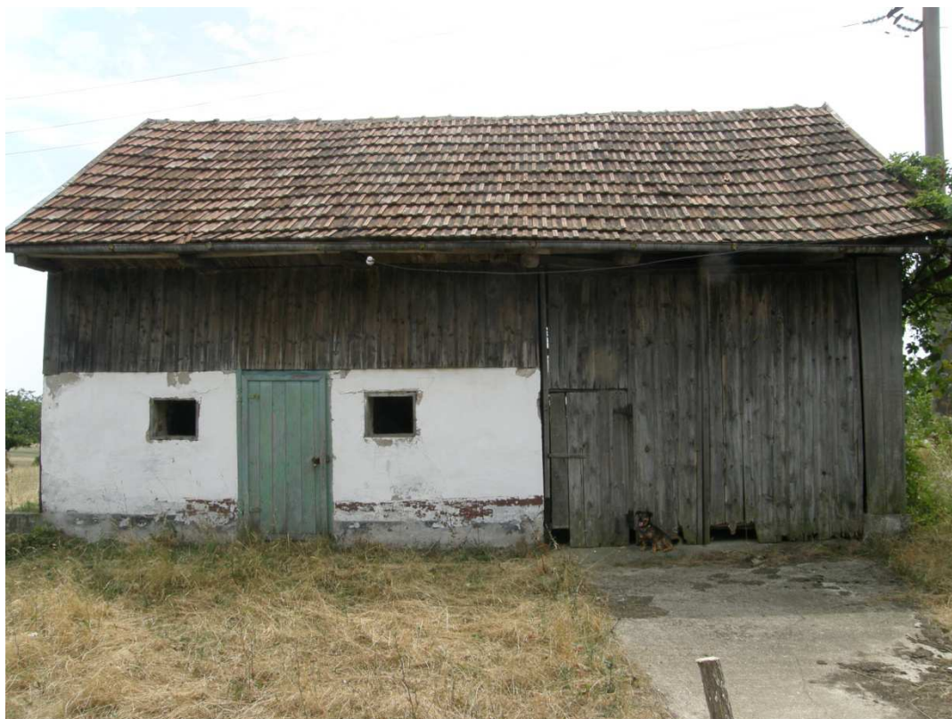
Boční pohled na stodolu se zděným chlévem a dvoukřídlou bránou pro vjezd povozu. Nad chlévem se nacházel poval pro uskladnění sena.