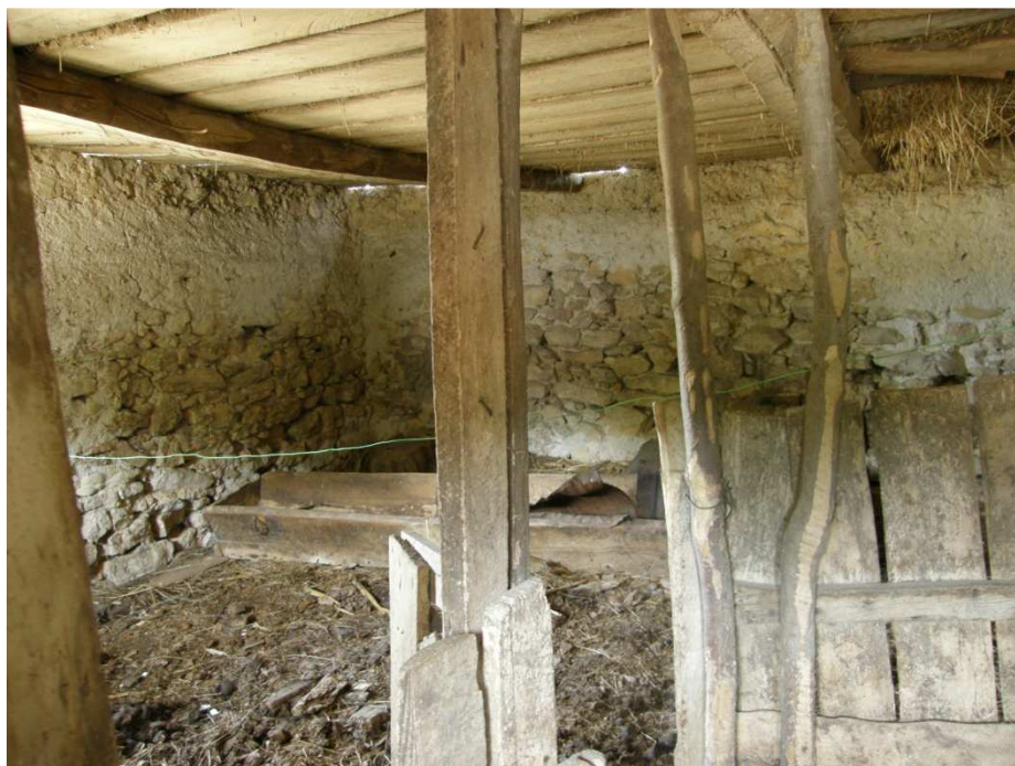
Chlív pro dobytek, je budován z místního vápencového kamene, stěny jsou pouze zalíčeny vápnem. Strop tvořen stropními trámy a povalem. Řada podpěrných sloupků a pevných stání tvořila příležitostné a variabilní koje pro zvířata.