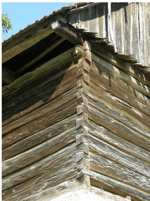
Gerník, 2015, detail roubení dřevěné hospodářské stavby.

Z mnohých udržovaných a opravovaných domů lze cítit pečlivou starost a pochopení, že postupné a průběžné udržování historických konstrukcí je tou nejlepší cestou k dlouhověkosti domu. Klasické materiály, jednoduché konstrukční tvary a tradiční praktické uspořádání objektů uvnitř i v rámci hospodářství je pro dané podmínky natolik ideální, že není třeba vnášet do objektů i do vesnického prostředí nové prvky. I přes památkovou ochranu prostoru by nemělo dojít k zakonzervování a zákazu modernizace stavebního fondu. Ta by se ale měla odehrávat citlivě, s úctou k práci našich předků, vědomě ohledně udržitelnosti života a zbytečného nenahrazování toho, co slouží a lze pietně ošetřit či opět vhodnou obnovou navrátit do života. Obec Gerník disponuje velmi hodnotným autentickým prostředím s neopakovatelným geniem loci , který by měl být pietně ochraňován a střežen navzdory světové globalizaci a unifikovanosti. Jedinečnost místa v němž se snoubí bohatá historie, pohádkové přírodní scénérie a vzácně dochovaná architektura může být do budoucna lákadlem nejen pro turisty, hledající v divokých horách odpočinek a pohádkovou atmosféru zmizelého času.