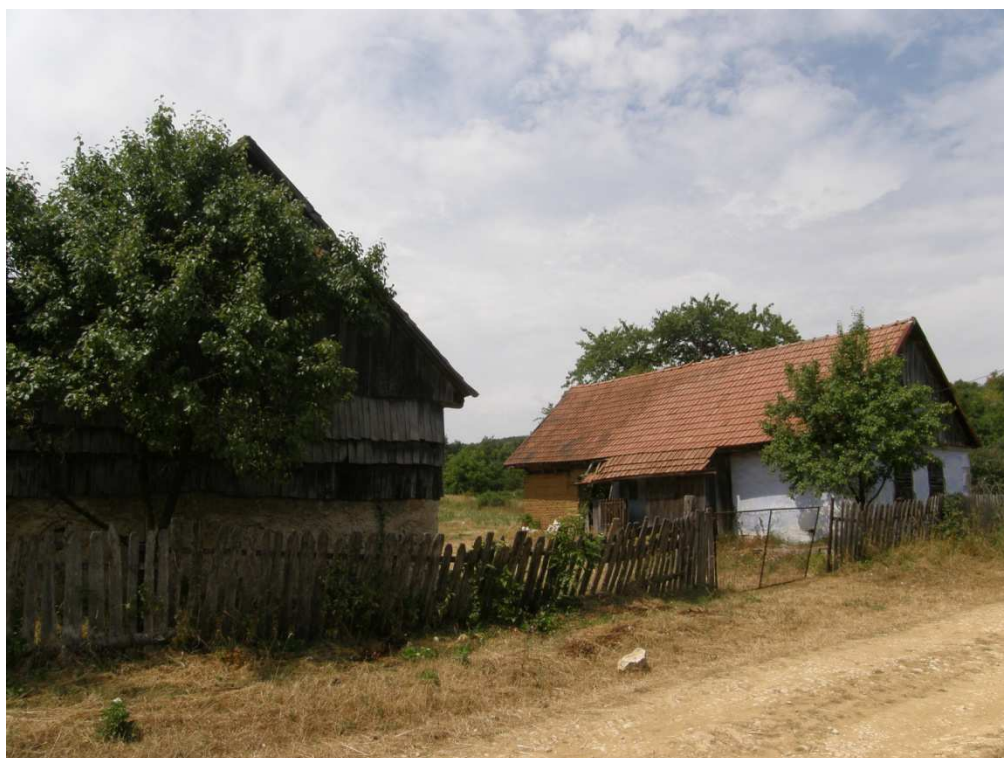
Gerník, obytný dům se stodolou a zahradou