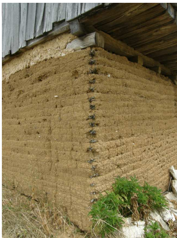
Detail navázání pultové stříšky na předsazený poval. Hliněné omítky v zadní části domu s armovaným nárožím.