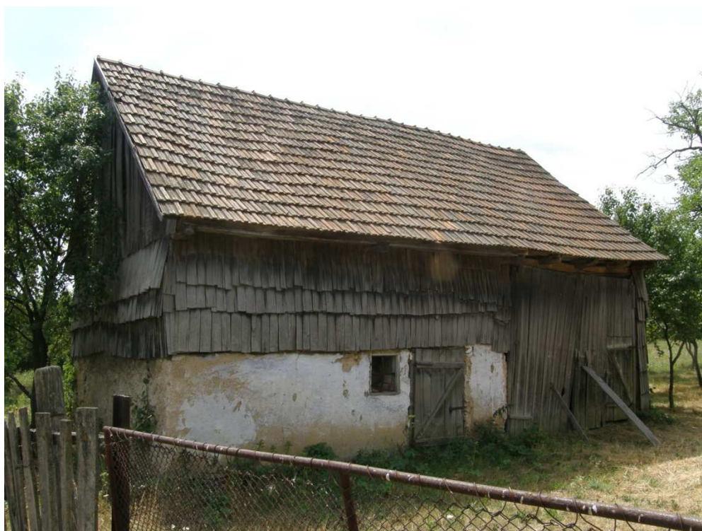
Hospodářská budova částečně zděná sloužící pro dobytek. Horní část opatřená širokým šindelem sloužila pro uskladnění sena, obilí, atd. Zprava je patrný vjezd pro povoz. Střechu kryla pálená drážkovaná taška.