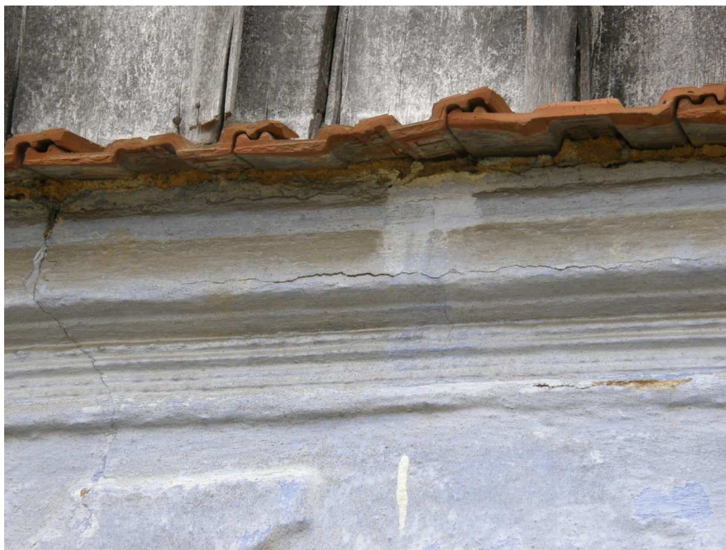
Detail profilované korunní římsy předsazené před dřevěný dešťový štít. Je kryta pálenou drážkovanou střešní taškou v jedné řadě.