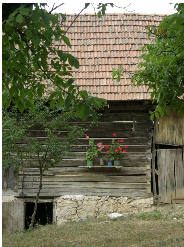
Gerník, 2015, roubená stodola na kamenné podezdívce.

Obec Gerník prošla v období 70. a 80. let 20. století velkou modernizací, právě proto bylo zmapováno pouze 30 selských usedlostí pro zapsání za kulturní památky. Přes výraznou obnovu si však téměř všechny stavby dochovaly své původní půdorysné stopy, hmotové měřítko, tradiční sklon střech a tradiční uspořádání hospodářského dvora. Právě z tohoto důvodu doporučujeme vyhlásit pro celou obec plošnou památkovou ochranu – vesnickou památkovou zónu, nebo zajistit formou platné vyhlášky obecné povahy přísné stavební regulativy, kdy by musela být respektována výška stavby, sklony a tvary střech, půdorysná stopa, používání tradičních materiálů, přičemž přístavby v rámci dvorních traktů by bylo možné akceptovat. Pouze vytvořením striktní a důrazně dodržované regulace může dojít k záchraně autenticity, hodnoty genia loci starobylých vesnic, pro něž jsou krajanské obce rumunského Banátu tak hojně navštěvované nejen českými turisty.