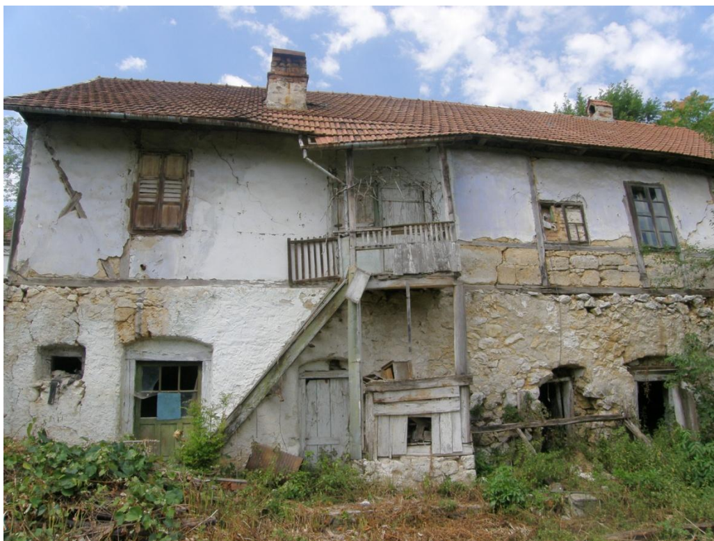
Dvorní strana domu prozrazuje, že spodní část domu je v celém objektu vybudována z místního kamene na maltu vápennou. Přízemí ze strany dvora sloužilo jednoznačně k ustájení drobného zvířectva, případně i potravin. Dveřní i okenní otvory převážně obdélných tvarů byly zaklenuty mírným segmentovým obloukem vyzděným z cihel. Výplně v současné době již v torzálním stavu jsou dřevěné. Dveře částečně plné, deskové, nebo částečně prosklené. Horní část stavby je vybudována z hrázďeného zdiva. Hlavní konstrukci tvoří spodní a horní práh, sloupy a diagonální vzpěry. Plochy pak vyplňuje ručně opracovaný kámen nebo cihla. Ve středu dispozice domu byla umístěna dřevěná krytá podesta v patře přístupná ze dvora dřevěným schodištěm. Byla vystavěna na zděné kamenné podezdívce a byla vynášena několika dřevěnými sloupy.