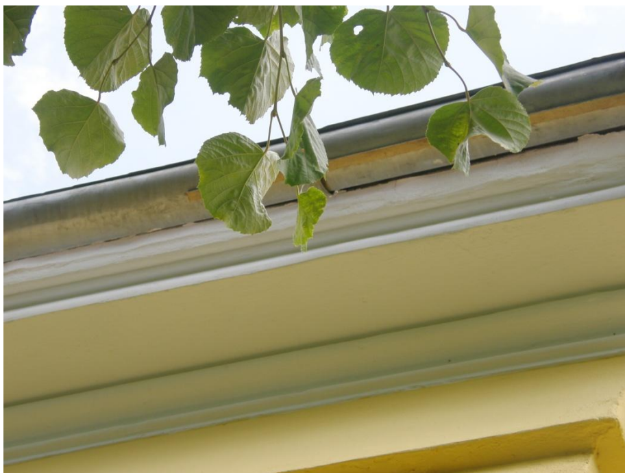
Pohled na profilovanou korunní římsu s výrazně předsazenou hranou.