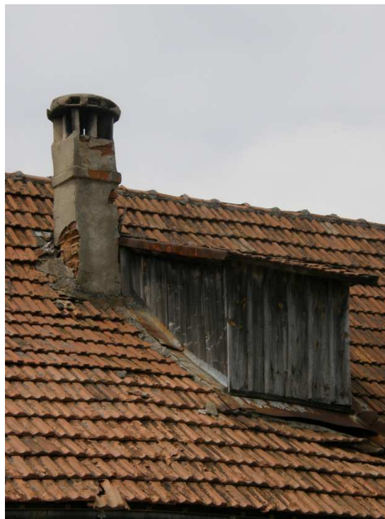
Dřevěné výplně verandy s vejcovcem v horní části okna. Novodobý komín s pultovými výlezem na střechu.