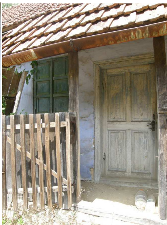
Deštěná část verandy s pultovou střechou. Hlavní vstupní dveře v ose domu, jsou rámové s vpadlinami a vystupujícími kazetami. Jsou usazeny do dřevěného rámu s profilovanými obložkami. Vlevo je patrná dvoukřídlová plná okenice. Přístřešek má částečně plné stěny a částečně je doplněný plaňkovým plůtkem s vrátky .