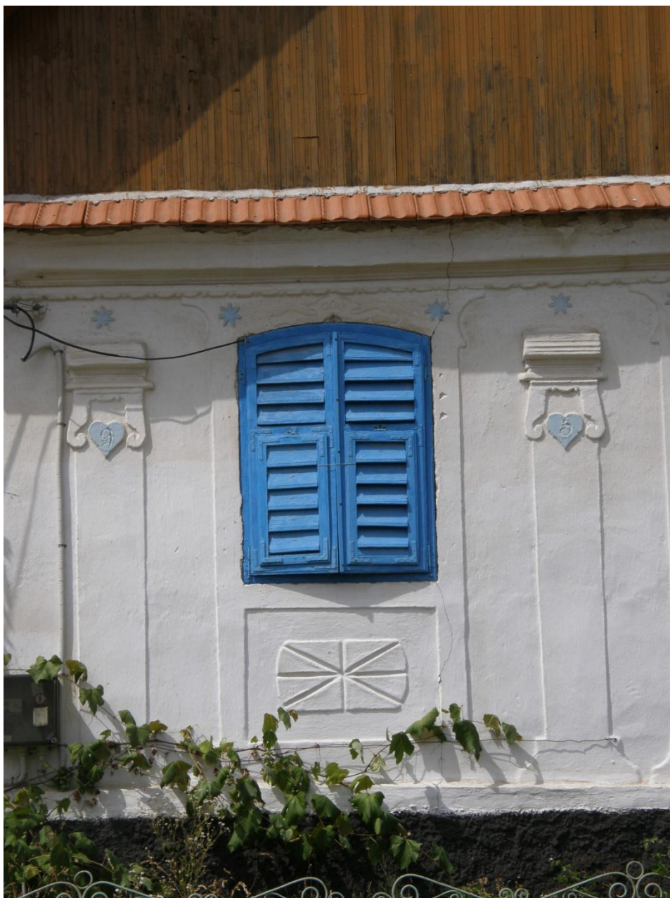
Detail zdobení štukové fasády polopilastrů s římsovými hlavicemi, dekorem srdce a profilovanou patkou.