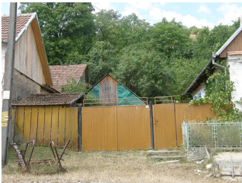
Hospodářství je ohrazeno deskovým plotem, za nímž se nachází malé hospodářské stavení se sedlovou střechou krytou pálenou taškou a dále v hloubi dvora pak další větší hospodářská stavba s plechovým štítem, sedlovou střechou. Vrata jsou novodobá, dvoukřídlová, stejně jako jednokřídlová branka a navazující oplocení. Úzké desky jsou opatřeny světle hnědým nátěrem.