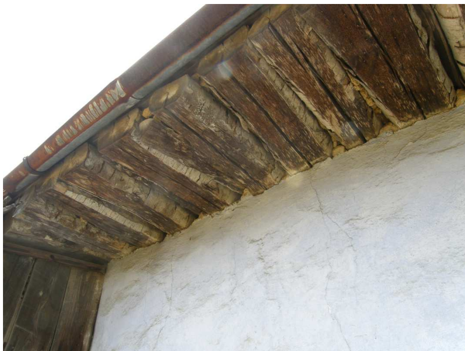
Detail dřevěného povalu tvořícího hlavní nosnou konstrukci stropu. Poval tvořily ze dvou stran hraněné trámy, přičemž mezery mezi nimi byly vyplňovány jílovitou mazaninou.