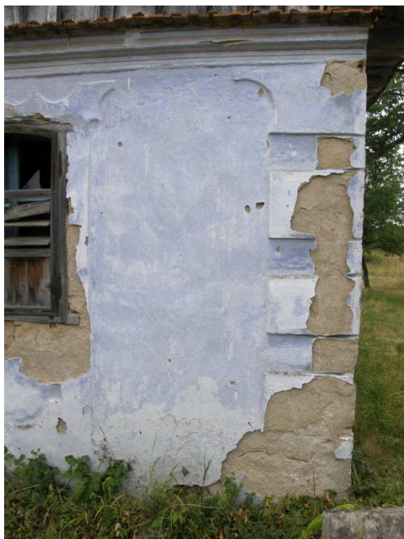
Detail kvádorvanání na nároží domu s konkávě vykrojeným horním kvádrem imitujícím hlavici pilastru.