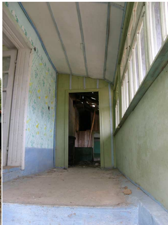
Vstupní dvoukřídlové dveře na verandu s vpadlinami a částečným prosklením. Interiér verandy s betonovou podlahou a tradiční výmalbou.