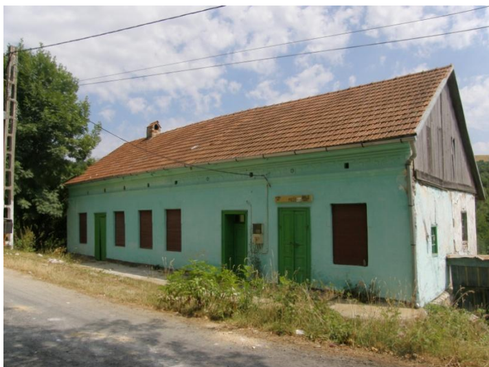
Pohled na uliční průčelí. Okenní i dveřní výplně byly v průběhu existence domu různě upravovány za účelem aktuálního využití.