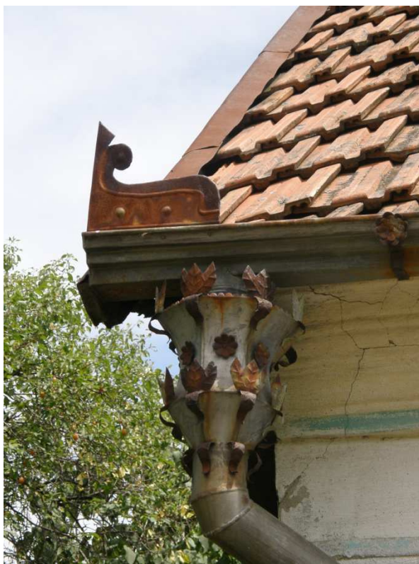
Okenní otvor lemován profilovanou plochou šambránou a profilovanou podokenní římsou. Klempířsky zdobený kotlík na dešťovou vodu.