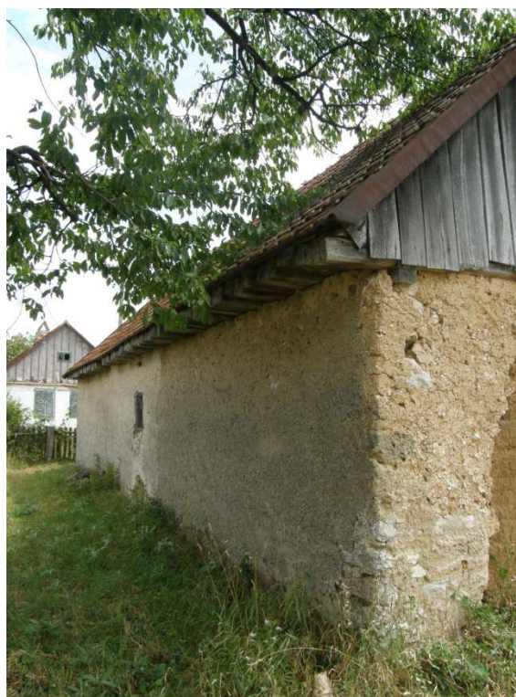
Detail zadního štítu s povalem, pozednicí a hliněným armováním. Boční stěna domu s tvrdými vápennými omítkami, štít je dřevěný deštěný.