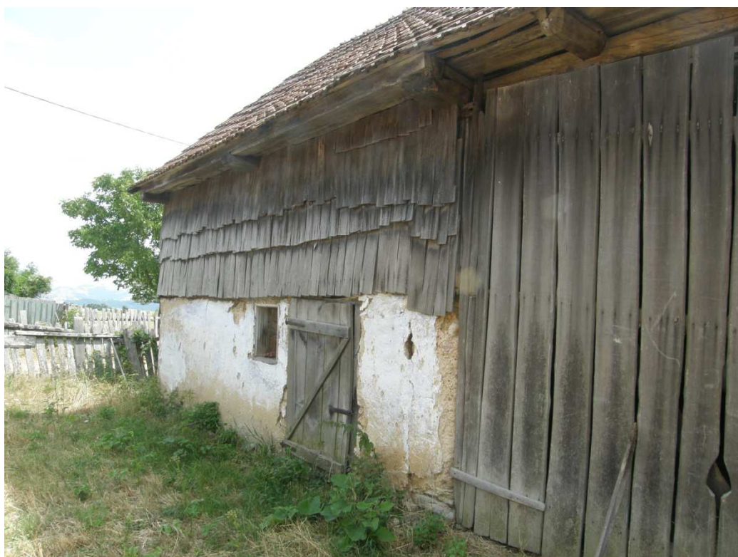
Částečně zděná stodola sloužila jak chlív pro dobytek s jedním dvoukřídlovým vstupem a okenním otvorem.