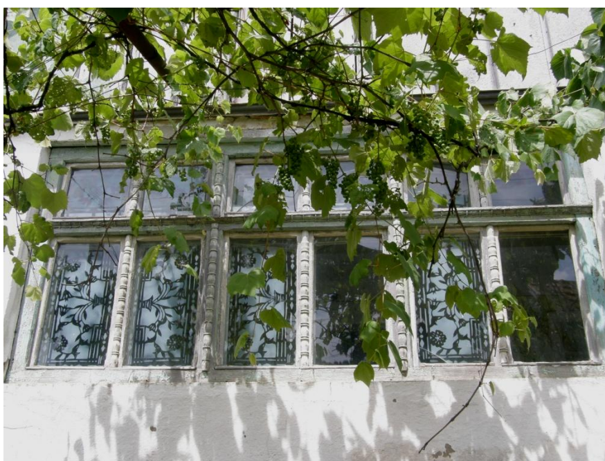
Gerník, 2015, dřevěná okna s vejcovcem na poutci i na klapkách, rekonstrukce 70. léta 20. století.

přirozenou součástí uzavřeného domu, vkládaly se do nich koupelny, sociální zařízení. Podlahy byly betonovány, dymníky měněny na udírny a tím pádem docházelo k zastropování kuchyní. V některých případech bylo razantně zasaženo i do původní dispozice, někdy docházelo k rozšiřování obytných ploch zakomponováním starší hospodářské budovy přímo navázané na obytný dům. Fasádám byl odepřen historický štukový dekor (polopilastry, lezénové rámce konkávně vyduté v nárožích, podparapetní kazety), který byl nahrazován spíše jednodušší lineární výzdobou v podobě předsazených říms, lezénových vpadlin. Započalo se s úpravami také hospodářského dvora, který byl v mnoha případech betonován. Změn doznalo i oplocení, kdy původní deskové ploty nahradily kovové dílce s drátěnou výplní a rozvilinovými dekory z kovových prutů usazené mezi kovové zabetonované sloupky. Při posledních zásadnějších úpravách se započalo s používáním tvrdých cementových omítek a betonu, což jsou materiály nepřilíhající kompatibilní s tradičními stavebními prvky a konstrukcemi.