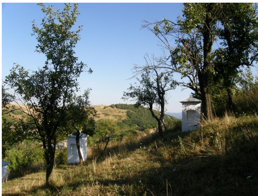
Gerník, 2015, Křížová cesta.

V následující části textu se nachází soubor 32 objektů mezi nimi i sakrální a technické stavby, které s ohledem na své stáří, na míru dochování původních konstrukcí a to, že se jedná o typický příklad z daného období, byly vybrány za adepty na kulturní památky. Jedná se především o objekty výrazněji rekonstruované ve 30. letech 20. století. Zbývající objekty sice byly modernizovány, ale přesto si i nadále uchovaly svou původní hmotovou skladu – půdorysnou stopu, objem hmoty zděné stavby, tvar a sklon střešních rovin a ve většině případů i tradiční materiály – dřevo, keramickou tašku. Toto je velmi důležitý předpoklad k vnímání daného vesnického prostoru v tradiční perspektivě. Je to důležitý faktor, který přispívá k pocítění genia loci a je tedy dobrým předpokladem pro vyhlášení plošné památkové ochrany, která by umožnila stavební, urbanistickou i estetickou regulaci.