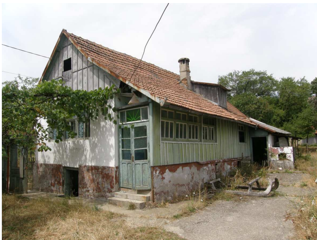
Dvorní pohled na dům s uzavřenou dřevěnou verandou. Objekt je podsklepen a dům má zvýšené přízemí.