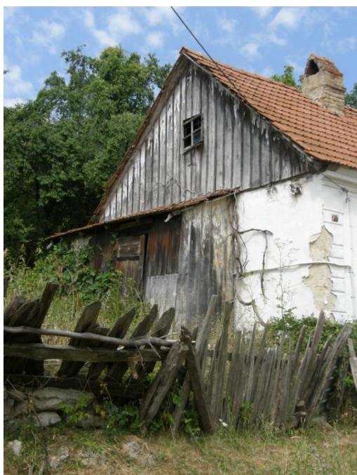
Detail štítu se dřevěnou přístavbou.

Průčelí podélného domu je prolomeno trojicí okenních otvorů doplněných dřevěnými žaluziovými výplněmi otevíravými i částečně výklopnými. Jsou usazeny na v líci fasády a rámuje je dřevěná profilovaná obložka. Jejich nátěr je světle šedomodrý. Fasáda je opatřena hladkou vápennou omítkou s bílým nátěrem a je bohatě dekorativně pojednána. V kartuši na fasádě se dochoval nápis s letopočtem 1933. Fasádu zdobí pět vpadlých ležénových rámců, jejichž vnitřní hrany jsou odstupňovány a zaobleny. Nároží a plochu mezi prvním a druhým okenním otvorem doplňují mírně předsazené polopilastry s kvádrováním. Pod okny se nachází obdélný vpadlý kvadrilob se zaoblenými vnitřními hranami. Fasáda dosedá na šedočerný sokl – vápenná omítka doplněná popelem za účelem zlepšení hydroizolačních vlastností omítky. Korunní římsa je bohatě profilovaná.