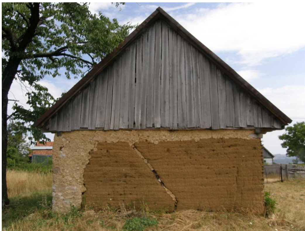
Dvorní štít domu s dřevěným deskovým štítem. Omítky jsou částečně hliněné a částečně tvrdé vápenné. U hliněných omítek je patrné armované nároží. Omítky i bez nátěrů vykazují značnou odolnost.