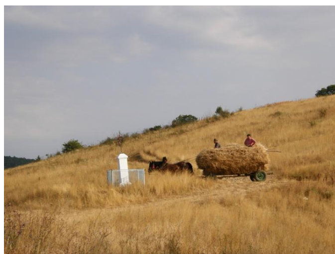
Gerník, 2015, svoz sena.

V rámci plošné památkové ochrany jde o to zachovat tradiční hmotovou skladbu jednotlivých objektů vytvářejících ucelený urbanistický soubor vesnické architektury. Podstatná je opět tradiční půdorysná stopa, původní hmoty domů včetně jejich tvaru střech. Rozhodně by se mělo upustit od myšlenky nástaveb. Rozšiřování obytné plochy by se mělo opět odehrávat v neveřejném prostoru vnitřních dvorů. Důraz by měl být kladen na citlivé úpravy fasád, které by měly ochraňovat co nejvíce dochované prvky – štukové dekory i truhlářské výplně, a to dle jejich míry autentického dochování. Nové úpravy fasád by měly vycházet z tradičního pojetí a historického výrazu. Novostavby objektů by se měly odehrávat buď na parcelách po demolovaných objektech, nebo na prázdných parcelách v intravilánu obce. Rozhodně by měly dodržovat tradiční spíše drobnější hmotové měřítko, obdélníkovou půdorysnou stopu, sedlové tvary střech. Poměrně podstatným, ale velmi důležitým detailem v exteriéru je oplocení. Oplocení by mělo využívat původního materiálu, mělo by pracovat s původními tvary i se způsobem tradičního opracování.