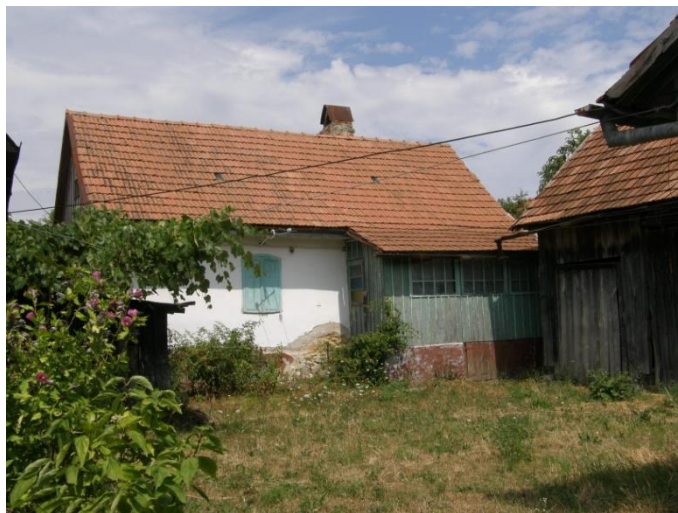
Gerník, 2015, dům štítové orientace s uzavřenou verandou.

V rámci plošné památkové ochrany jde o to zachovat tradiční hmotovou skladbu jednotlivých objektů vytvářejících ucelený urbanistický soubor vesnické architektury. Podstatná je opět tradiční půdorysná stopa, původní hmoty domů včetně jejich tvaru střech. Rozhodně by se mělo upustit od myšlenky nástaveb. Rozšiřování obytné plochy by se mělo opět odehrávat v neveřejném prostoru vnitřních dvorů. Důraz by měl být kladen na citlivé úpravy fasád, které by měly ochraňovat co nejvíce dochované prvky – štukové dekory i truhlářské výplně, a to dle jejich míry autentického dochování. Nové úpravy fasád by měly vycházet z tradičního pojetí a historického výrazu. Novostavby objektů by se měly odehrávat buď na parcelách po demolovaných objektech, nebo na prázdných parcelách v intravilánu obce. Rozhodně by měly dodržovat tradiční spíše drobnější hmotové měřítko, obdélníkovou půdorysnou stopu, sedlové tvary střech. Poměrně podstatným, ale velmi důležitým detailem v exteriéru je oplocení. Oplocení by mělo využívat původního materiálu, mělo by pracovat s původními tvary i se způsobem tradičního opracování.