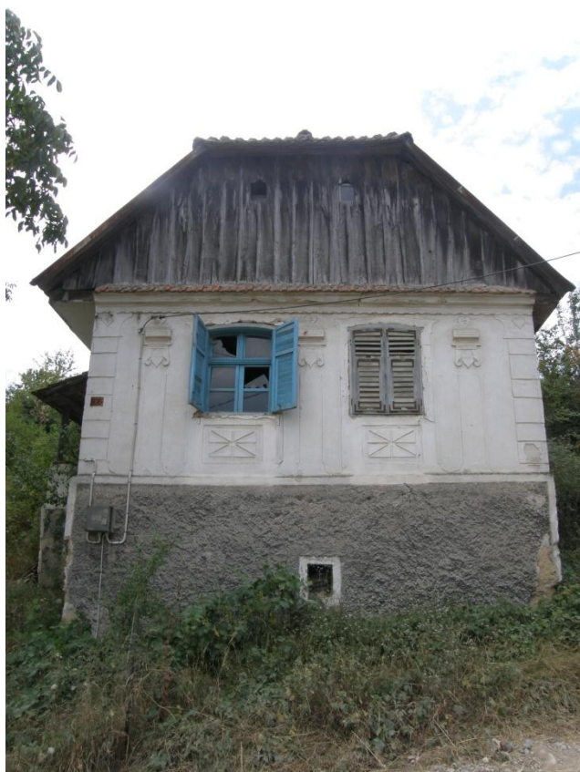
Gerník, 2015, dům štítové orientace vystavěný na vysoké kamenné podezdívce, v suterénu – zaklenutý sklep, fasáda charakteristická pro úpravy ze 30. let 20. století.

nejdou stoprocentně izolované, proto do jejich konstrukcí vniklá vlhkost. Při užití plastů do oken nebo tvrdých omítek na fasády, případně užití zateplení, bude docházet z dlouhodobého hlediska k uzavírání povrchů a nemožnosti přirozeného odvětrávání vlhkosti z konstrukcí. Vlhkost v konstrukcích bude jednoznačně znamenat postupnou a nenávratnou degradaci všech stavebních materiálů – kamene, vepřovice, cihel, omítek, atd. Nehledě na skutečnost, že soudobými materiály dochází k unifikaci stavebních projevů jednotlivých regionů a vytrácí se zcela genius loci daného prostředí.