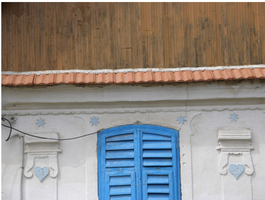
Detail rozviliny ve vrcholu okenní šambrány, a krajkový dekor pod bohatě profilovanou korunní římsou. Okenice jsou zpevněny kovovými rohovníky.