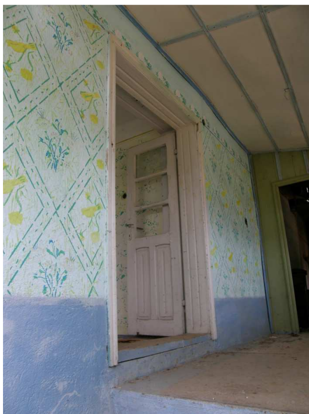
Tradiční šablonová výmalba v zelenkavých, modrých a žlutých tónech. Vstupní dveře do světnice – dvoukřídlové, částečně prosklené, částečně plné s profilovanými obložkami.