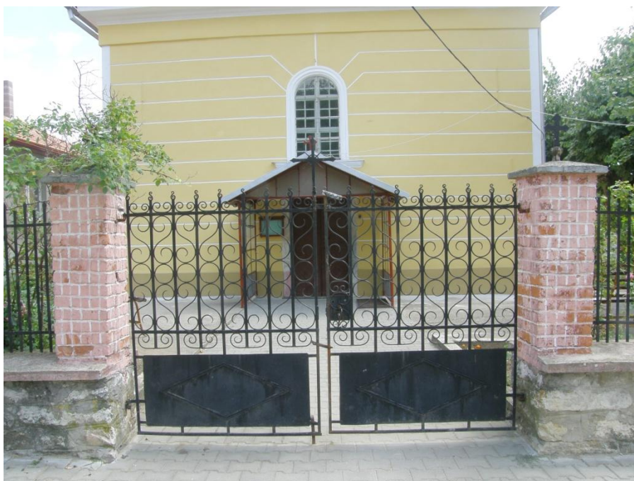
Pohled na hlavní vstupní dvoukřídlovou bránu. Novodobý prvek ze 70. let 20. století s typickým zdobným rozvilinovým dekorem mezi vertikálními tyčemi. Spodní část brány je opatřena plným plechem.