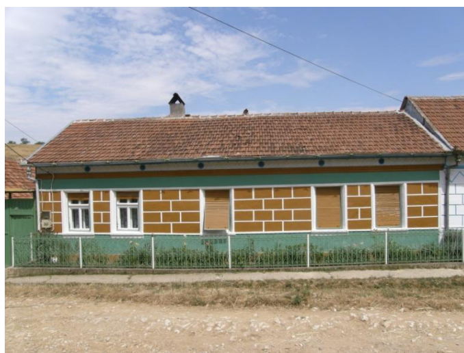
Gerník, 2015, fasáda domu je charakteristická pro 70. léta 20.století.

Výjimečně, ale přesto byly některé fasády doplněny keramickým barevným lesklým i matným obkladem, který vytvářel pravidelný geometrický dekor. U některých objektů okapové orientace si čtvrtpatro nad korunní římsou uchovalo původní starší dekorativní výzdobu, jindy byl dekor i v tomto místě zjednodušen na protáhlé kosočtverce a květinový zjednodušený dekor spíše linárního charakteru. Okenní otvory byly nejspíše mírně zvětšeny, přesto si ve většině případů zachovaly obdélný tvar. Jejich výplně byly čtyřkřídlové, většinou kastlíkové otevíravé dovnitř. Rámy křídel si zachovaly jemné profilace zakončené jazýčkem, poutce i klapačky byly ozdobeny tzv. vejcovcem. Výplně byly i nadále doplňovány žaluziemi, ale rolovacími sestavenými z tenkých lamel, které umožnily svinování. Dveřní výplně byly rovněž převážně jednokřídlové, rámové plné s profilovanými kazetami a vpadlinami.