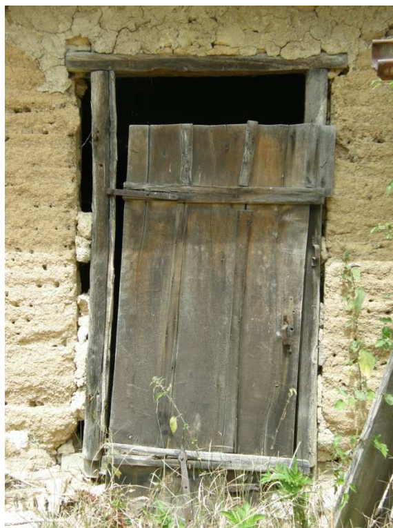
Dvorní štítová stěna stodoly opláštěná deskami a šindelem. Vstupní vrátka do hospodářské části obytného domu s navazujícími původními omítkami.