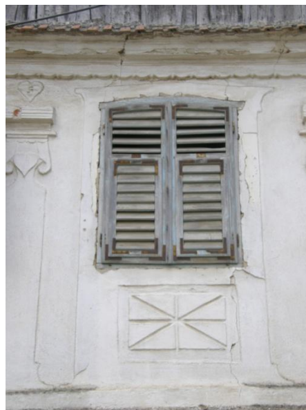
Gerník, 2015, detaily štukové výzdoby uličních fasád z období 30. let 20. století.

Podparapetní kazeta byla dále doplněna obdélnou vpadlinou a následně vystupujícím kvádrem s vyrytou rozetou, nebo naopak s obdélným vpadlým kvadrilobem, jehož vnitřní nároží byla opět konkávně vydutá. Korunní římsa byla velice jemně profilovaná a výrazně předsazená. Byla krytá pálenou taškou v jedné nebo ve dvou řadách. Tvar okenních otvorů byl obdélný. Výplň tvořil kastlíkový rám, vnitřní výplň dvou nebo čtyřkřídla s členěním křídel na další tabulky profilovanými příčlemi. Vnější výplň tvořila dvoukřídlová žaluziová okenice s pohyblivými lamelami. Křídlo okenice se otvíralo a zároveň byly 2/3 křídla okenic i výklopné. Na domě štítové orientace se nacházely převážně dvě nebo tři okenní výplně, na okapově orientovaném domě bylo otvorů pět, nebo i čtyři. Dveřní výplň vstupních dveří tvořila jednokřídlová plná rámová výplň s vpadlinami a vystupujícími kazetami. Rám dveří byl opatřen vždy profilovanou obložkou. Truhlářské prvky byly opatřeny krycím nátěrem výrazné barvy, buď šmolkově modré nebo šedomodré. Vstupy do dvorů bývaly opatřeny dvou nebo trojkřídlovými vraty z plných desek. Bránu chránila sedlová nízka a krátká stříška. Oplocení předzahrádky i dvora tvořily širší desky, nebyly přisazené těsně k sobě. Do jaké míry prošly domy v období 30. let 20. století rekonstrukcí interiéru, nebylo možné zjistit díky absenci znalosti vzhledu starších objektů a díky nemožnosti procházet interiéry.