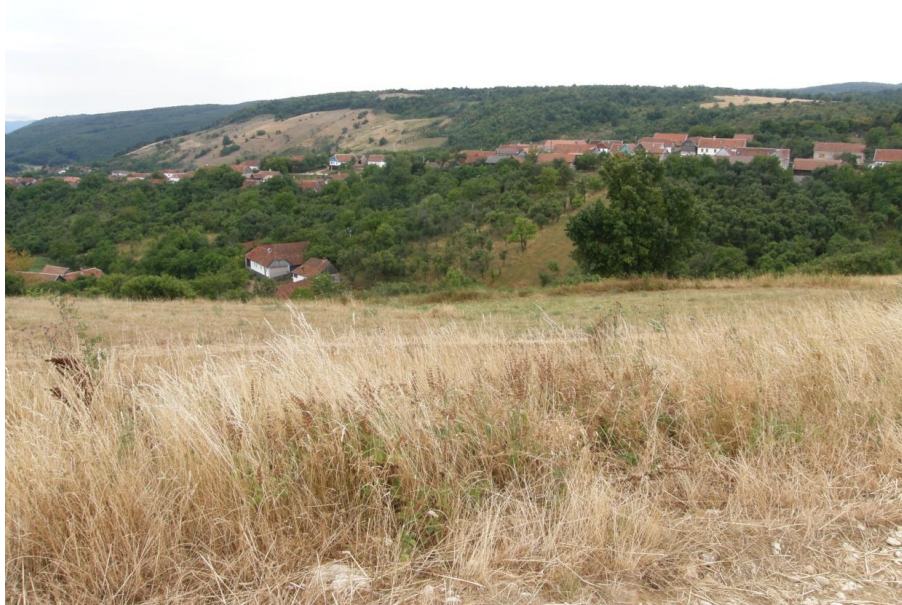
Gerník, 2015, celkový pohled na obec východu.