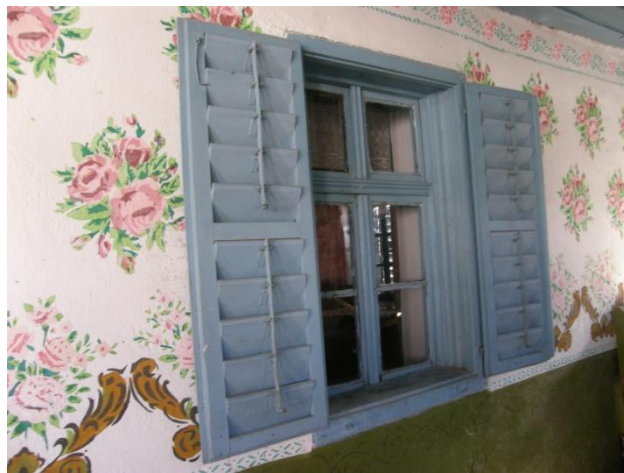
Gerník, 2015, okenní výplň z interiéru, původní okenní výplň s okenicemi se nacházela do otevřené verandy (dnes veranda uzavřená, výplň tvoří součást interiéru).

Druhou, větší skupinou objektů v Gerníku tvoří ty, které prošly rekonstrukcí v 70. a v 80. letech 20. století. Veskrze se tyto modernizační tendence dotýkaly objektů okapově orientovaných. Došlo k úplnému odstranění dekorativní fasády. Okenní otvory si ponechaly svůj obdélníkový tvar, došlo k mírnému rozšíření rozměrů. Nová výzdoba fasád byla velmi jednoduchá a měla dva základní typy. První se ve své podstatě omezoval pouze na mírně předsazený sokl, na zcela hladkou fasádu. Mezi okny se po celé délce domu nacházel horizontální vpadlý pás na výšku okenních otvorů. V některých případech se mezi okny v pásu vyskytovaly lineární jednoduché štukové prvky ve formě pásků a uprostřed nich drobný zjednodušený lineárně pojednaný květinový dekor. Druhou variantou bylo masivní kvádrování pomocí nut vyskytující se po celé ploše fasády v prostoru mezi soklem a římsou. Okenní otvory mohly a nemusely být rámovány profilovanou šambránou a podparapetní římsou. Fasádní omítky bývaly většinou tvrdé cementové. Nátěry různě barevné. Nechyběly ani kontrastně zvýrazněné nuty kvádrování, které dodávají celé stavbě opticky větší robustnost.