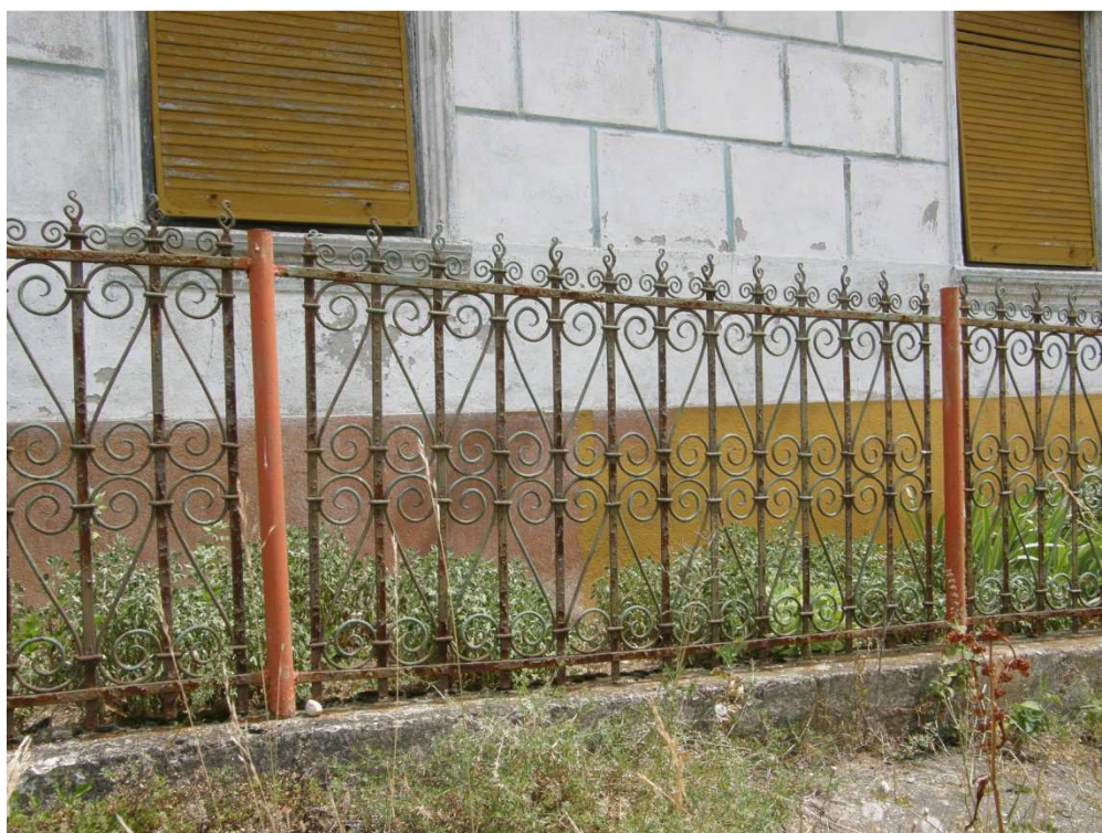
Novodobé kovové oplocení, pocházející asi ze 70. let 20. století. Kvalitní zámečnická práce