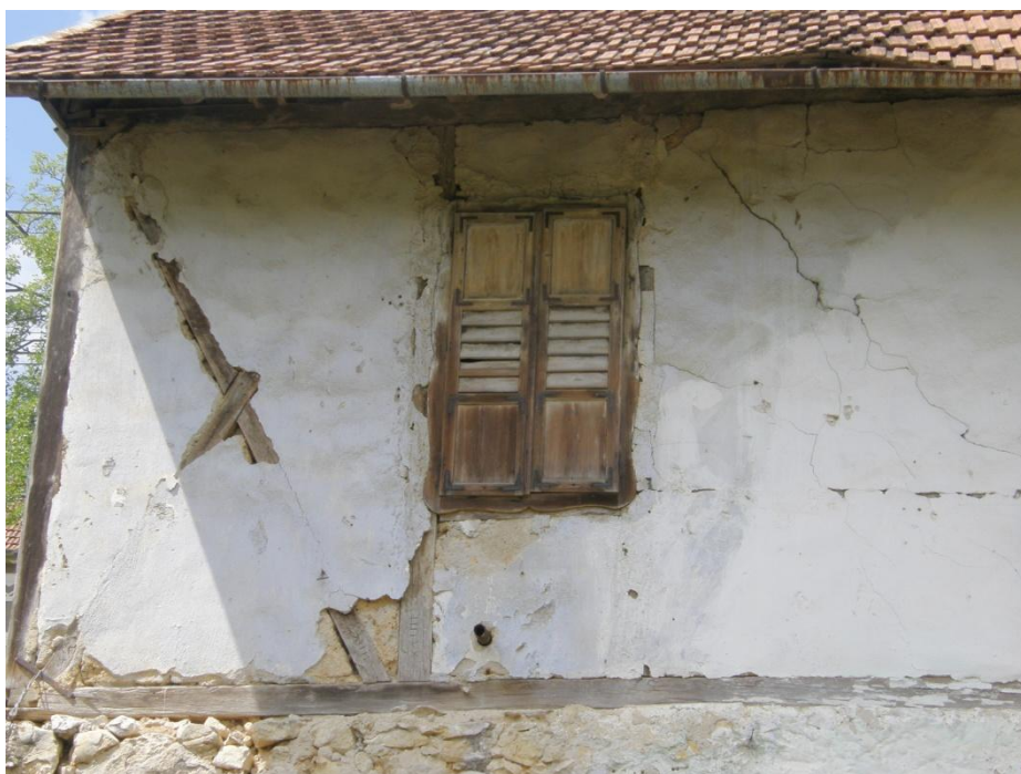
Detail hrázděné, omítané konstrukce horního patra doplněného obdélným okenním otvorem vyplněným dochovanou dvoukřídlovou částečně plnou a částečně prolamovanou okenicí.