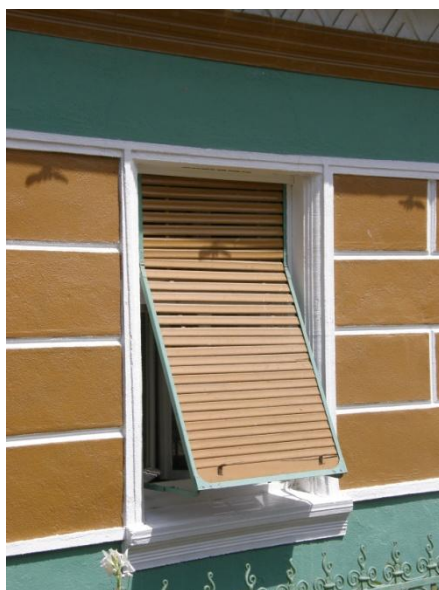
Gerník, 2015, novodobé vyklápěcí žaluzie ze 70. let 20. století.

Charakteristický rys truhlářských výplní z tohoto období jsou profilace zakončené jazýčkem. Míru stavebních zásahů v interiéru nebylo možné postihnout, ale předpokládá se výměna podlah za betonové, přitažení vodovodního potrubí, zřízení sociálního zařízení – koupelny, toalety. Zrušení dymníků a zastropení kuchyní. Dvou nebo trojkřídlové vrata jsou převážně plechové, spodní část plná a horní prosklená opatřená mřížemi ve tvaru rozvilinově stylizovaných kovových prutů, přičemž důraz byl kladen na kontrastně působící použitou barevnost. Vjezdy do dvorů ztratily své sedlové stříšky kryté pálenou taškou, které nahradily převážně plechové segmentově zohýbané plechy na kovových sloupcích. Změn doznalo i oplocení. Soklové zídky z kamene nahradily betonové, deskové ploty pak kovové sloupky, kovové rámy s drátěnými výplety a případně dekorativně pojednanými kovovými prvky.