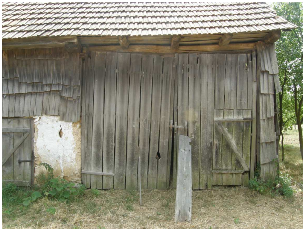
Dvoukřídlová brána sloužila pro vjezd povozu. Vpravo jednokřídlová vrátka.