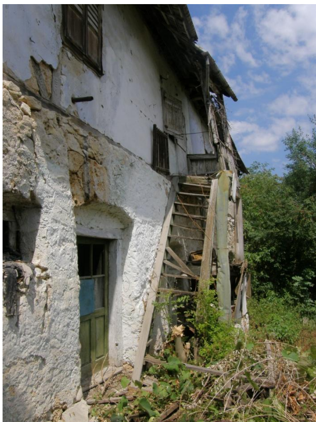
Detail jednoduchého dřevěného schodiště na podestu.