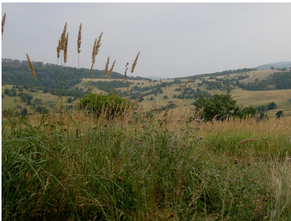
Gerník, 2015, pohled k Rovensku

Podstatou památkové ochrany jednotlivých objektů by nemělo být zakonzervování stávajícího stavu, který by znemožňoval objekty využívat, ale zachování hmoty, půdorysné stopy a měřítko stavby s důrazem kladeným na uchování maximálního množství funkčních historických konstrukcí. Současné živelné modernizační zásahy související s dožíváním původních stavebních prvků, znamenají jejich postupný zánik a nahrazování novými prvky převážně cizorodé podstaty (plasty, plechy, betony, cementy), které nejsou z dlouhodobého hlediska kompatibilní s historickými objekty. Navíc jejich používáním dojde k setření historického výrazu staveb a k úplné proměně obce, která tím zcela ztratí svého genia loci . Průběžná údržba historických konstrukcí, ctění tradičních stavebních zvyklostí, výměny dožilých prvků za materiálově identické, jsou jedinou správnou cestou pro zachování autenticity místa, ale především pro zachování samotné podstaty jednotlivých objektů. Přínosem bude jednak udržení tradičních řemesel, stabilní poctivé domy, zachování historických hodnot jednotlivých objektů, ale i tradičně uspořádaná vesnická sídla v adekvátním hmotovém měřítku a v přirozených materiálech.