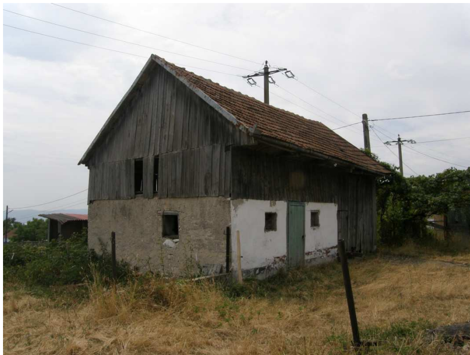
Hospodářská budova, částečně zděná pro dobytek, částečně dřevěná pro uskladnění obilí, sena atd. Zprava se nachází vjezd do stodoly pro povoz. Sedlová střecha krytá střešní pálenou drážkovanou taškou.