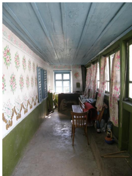
Gerník, 2015, uzavřená veranda zapojená do interiéru domu- vnější pohled, pohled do verandy.

V současné době v Gerníku převažují objekty, které prošly zásadní rekonstrukcí v 70. a 80. letech 20. století. Výjimkou ale nejsou ani obytné domy, u nichž byla opominuta modernizační fáze a zachovaly si dodnes své stavební formy ze 30. let 20. století.