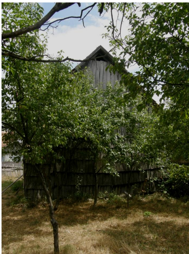
Gerník, 2015, stodola s dřevěným štítem krytá deskami a šindelem.

vložena současná letecká mapa Gerníku s očíslovanými objekty. Červeně očíslované domy jsou adepty na kulturní památky, černé očíslování značí objekty fotograficky podchycené jednou nebo více fotografiemi. Tyto objekty nejsou zařazeny do tištěné formy elaborátu, nacházejí se pouze na digitálním nosiči, který byl společně s tištěnou zprávou předán zadavateli projektu, jmenovitě Ivo Dokoupilovi. Na závěr je nutné podotknout, že až na vzácné výjimky, nebylo možné provádět dokumentaci interiérů.