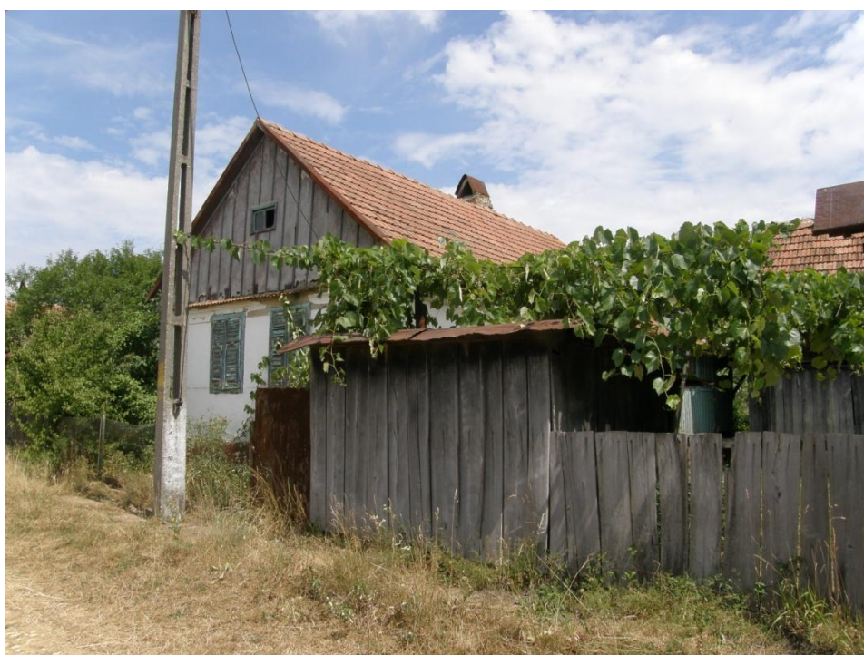
Gerník, 2015, obytný dům štítové orientace a jeho dvůr.

objektů v rámci vnitřního dvora. Přesný vzhled domů nelze jednoznačně určit, rámcově lze konstatovat, že domy byly buď štítové, nebo okapové orientace, měly obdélný půdorys a sedlové střechy s dřevěnými štíty. Dispozice obytného domu byla tvořena kuchyní, do níž se vstupovalo hlavními dveřmi. Byla usazená uprostřed domu. Měla hliněnou podlahu, otevřené ohniště na zděném soklu, které ústilo do vysokého širokého dymníku a do komínového tělesa. Z kuchyně se vstupovalo do dvou světnic – nalevo a napravo situovaných s plochým omítaným stropem a prkennou podlahou. V případě, že se dům nacházel ve svahu, byl vybudovaný na vysoké zděné podezdívce a prostor v ní vzniklý byl zaklenut a sloužil jako sklep.