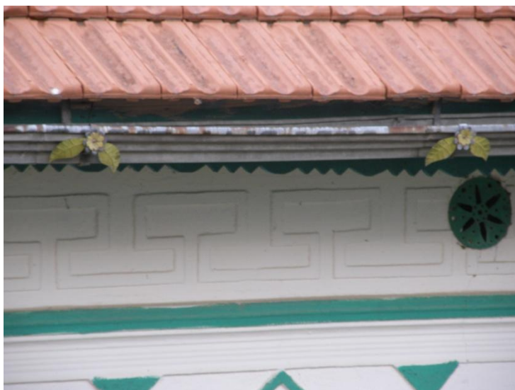
Gerník, 2015, čtvrt patro nad korunní římsou s dekorativní výzdobou a plechovou mřížkou ve tvaru rozety pro uzavření kruhového větracího průduchu.

Charakteristický rys truhlářských výplní z tohoto období jsou profilace zakončené jazýčkem. Míru stavebních zásahů v interiéru nebylo možné postihnout, ale předpokládá se výměna podlah za betonové, přitažení vodovodního potrubí, zřízení sociálního zařízení – koupelny, toalety. Zrušení dymníků a zastropení kuchyní. Dvou nebo trojkřídlové vrata jsou převážně plechové, spodní část plná a horní prosklená opatřená mřížemi ve tvaru rozvilinově stylizovaných kovových prutů, přičemž důraz byl kladen na kontrastně působící použitou barevnost. Vjezdy do dvorů ztratily své sedlové stříšky kryté pálenou taškou, které nahradily převážně plechové segmentově zohýbané plechy na kovových sloupcích. Změn doznalo i oplocení. Soklové zídky z kamene nahradily betonové, deskové ploty pak kovové sloupky, kovové rámy s drátěnými výplety a případně dekorativně pojednanými kovovými prvky.