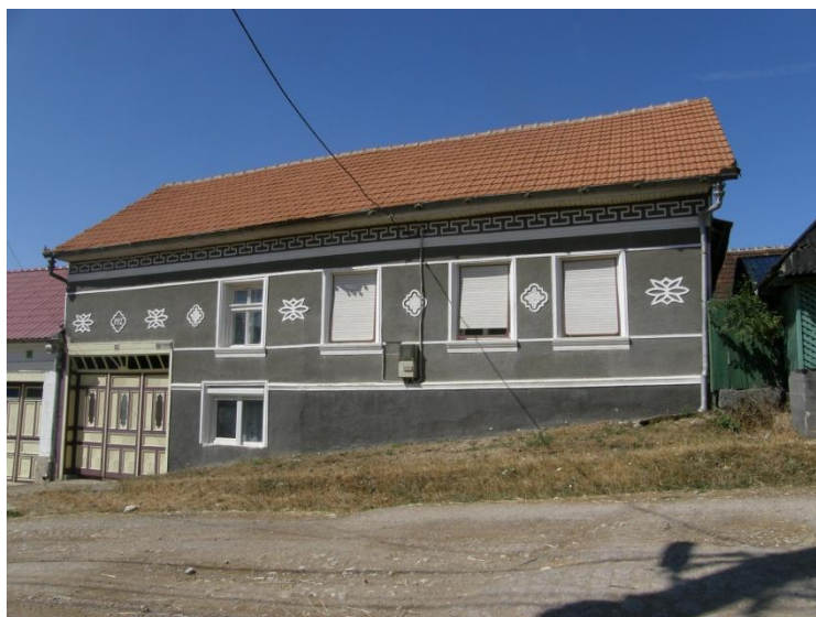
Gerník, 2015, dům okapové orientace po rekonstrukci v 70. letech 20. století, typ výzdoby fasády je pro dané období charakteristický.

Výjimečně, ale přesto byly některé fasády doplněny keramickým barevným lesklým i matným obkladem, který vytvářel pravidelný geometrický dekor. U některých objektů okapové orientace si čtvrtpatro nad korunní římsou uchovalo původní starší dekorativní výzdobu, jindy byl dekor i v tomto místě zjednodušen na protáhlé kosočtverce a květinový zjednodušený dekor spíše linárního charakteru. Okenní otvory byly nejspíše mírně zvětšeny, přesto si ve většině případů zachovaly obdélný tvar. Jejich výplně byly čtyřkřídlové, většinou kastlíkové otevíravé dovnitř. Rámy křídel si zachovaly jemné profilace zakončené jazýčkem, poutce i klapačky byly ozdobeny tzv. vejcovcem. Výplně byly i nadále doplňovány žaluziemi, ale rolovacími sestavenými z tenkých lamel, které umožnily svinování. Dveřní výplně byly rovněž převážně jednokřídlové, rámové plné s profilovanými kazetami a vpadlinami.