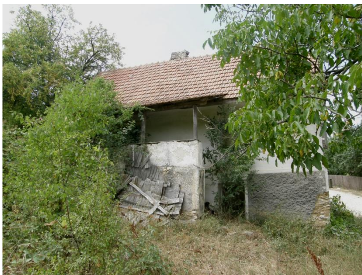
Gerník, 2015, otevřená veranda na zděném soklu podél vnitřní strany domu štítové orientace.

a přímo navazovala na vjezdovou bránu do dvora. Veranda stávala na zděné podezdívce, dřevěné sloupky vynášely podélnou vaznici, na níž spočívaly krokve napojené na stropní trámy přesahující líc zdiva. Střecha nad verandou byla pultová a plynule navazovala na střešní rovinu domu. Byla krytá stejnou krytinou, zpočátku šindelem, později pálenou taškou. Veranda byla otevřená, spodní partie byly buď plné, deskové, nebo doplněné pouze plaňkami. Hlavní vstupní dveře byly rámové, s ozdobnými kazetami, byly plné. Okenní výplně tvořily převážně dvoukřídlové jednoduše zasklené vnitřní výplně, zatímco vnější výplně sestávaly z dvoukřídlových okenic s pohyblivými žaluziemi.