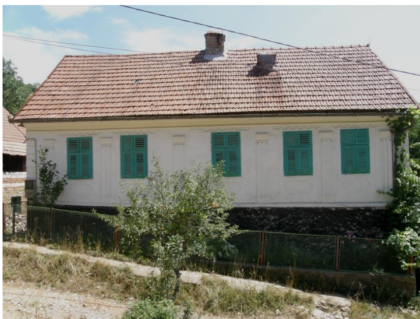
Gerník, 2015, dům okapové orientace s úpravou fasády ze 30. let 20. století.

Druhý typ domu byl okapové orientace, obdélného půdorysu se sedlovou střechou a dřevěnými deštěnými štíty. Znamenalo to, že delší strana obdélníku byla obrácená do ulice a tvořila průčelí domu. U těchto objektů se vyskytovala oproti domům štítové orientace jistá anomálie v podobě zděného čtvrtpatra. Nad korunní římsou průčelí byla vytvořena zděná nadezdívka, která byla přístupná z půdního prostoru. Tato partie byla prolomená řadou malých kruhových nebo obdélných průduchů zajišťujících provětrávání půdy. V tomto prostoru byly ze strany půdy instalovány dřevěné jednoduché konstrukce policového charakteru – palandy, na nichž se uskladovaly potraviny. Toto čtvrtpatro znamenalo, že střešní rovina směřující do ulice měla trochu jiný sklon střechy než její protější strana směřující do dvora.