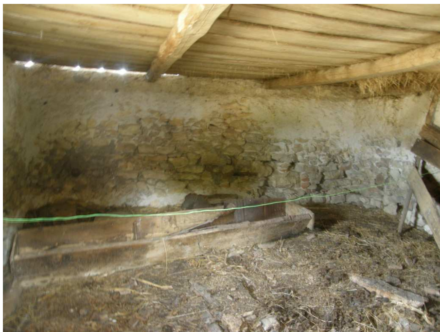
Vnitřní část chléva s dochovaným dřevěným žlabem, stěny zalíčeny vápnem, stropní trámy mají velký rozpon, což kompenzuje dřevěný poval.